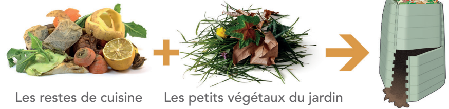
Les restes de cuisine Les petits végétaux du jardin

Pour tous renseignements : 05 53 29 87 50