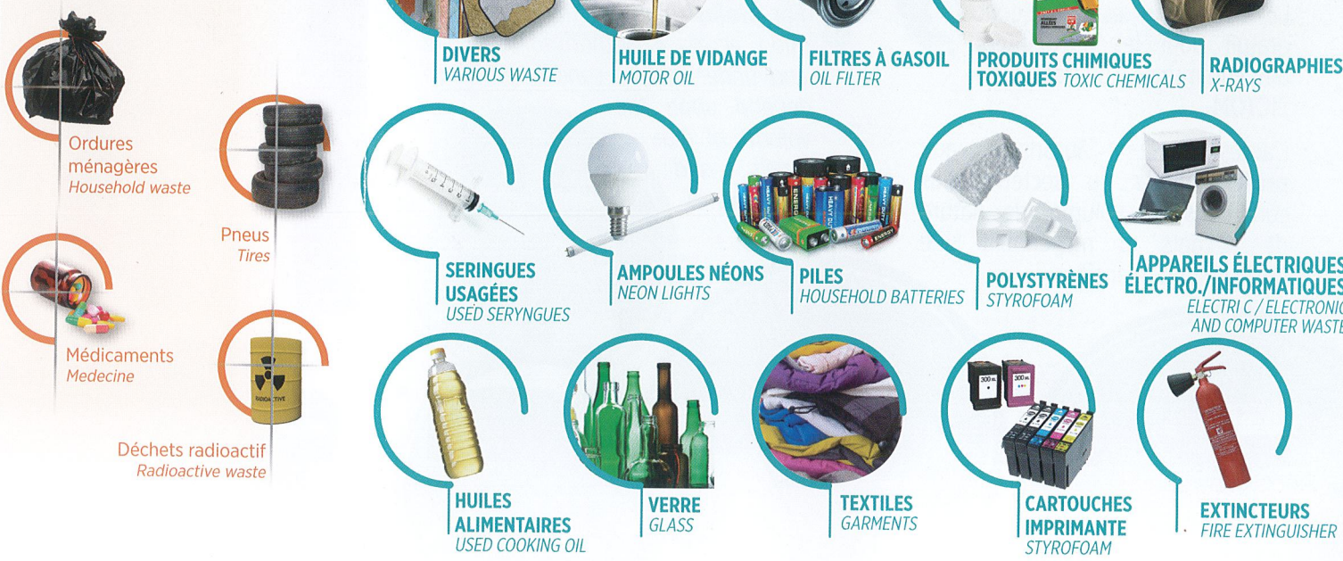
Ordures ménagères Household waste